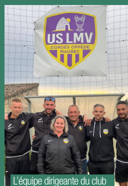
L'équipe dirigeante du club

L'inauguration officielle est prévue pour le printemps 2026. Elle marquera non seulement la renaissance d'un équipement sportif historique, mais aussi un moment fort pour tous les Oppédois, petits et grands, rassemblés autour d'un lieu qu'ils apprécient.