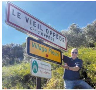
Nouveau panneau d'accueil du Vieil Oppède

Plus qu'une promesse, une réalité construite pas à pas