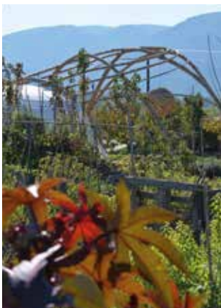
Jardin du Moutillon (Robion)