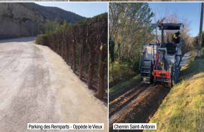
Parking des Remparts - Oppède le Vieux