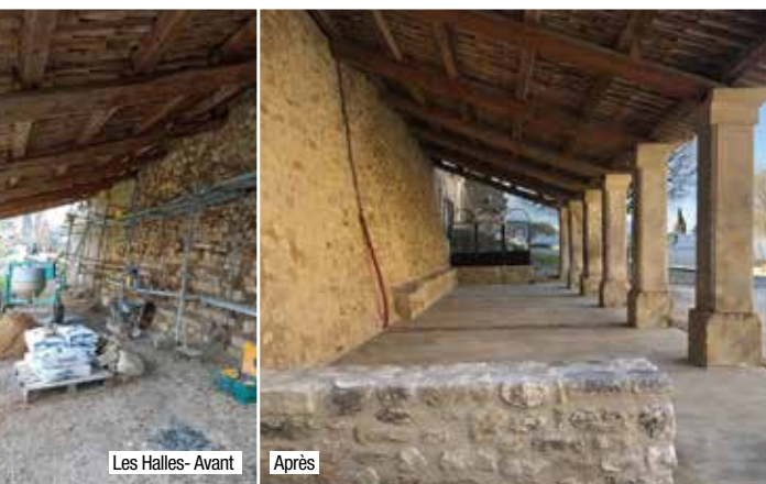
Les Halles - Avant