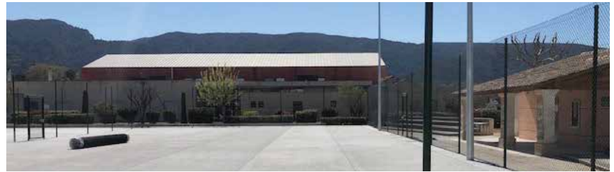
Travaux au 7 avril

Si vous souhaitez prendre des cours avec Anthony Ripoll le moniteur du club (Mobile : 06 58 72 76 86)